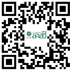
ระเบียบและประกาศที่เกี่ยวข้อง