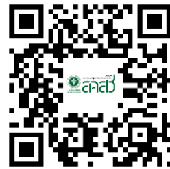
หลักสูตรความรู้พระราชบัญญัติสุภาพจิตฯ