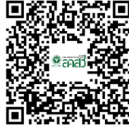
คู่มือการใช้ระบบบัตรประจำตัวพนักงานเจ้าหน้าที่ฯ