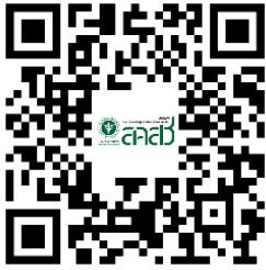
ระบบบัตรประจำตัวพนักงานเจ้าหน้าที่ฯ