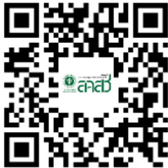
แบบฟอร์มที่เกี่ยวข้อง