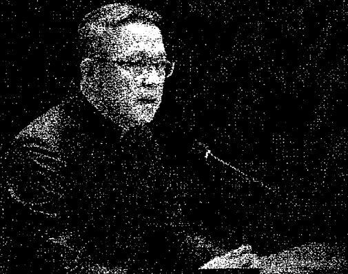
นายรัฐณัฐ สุทธิบุญผล อธิบดีกรมส่งเสริมการปกครองท้องถิ่น